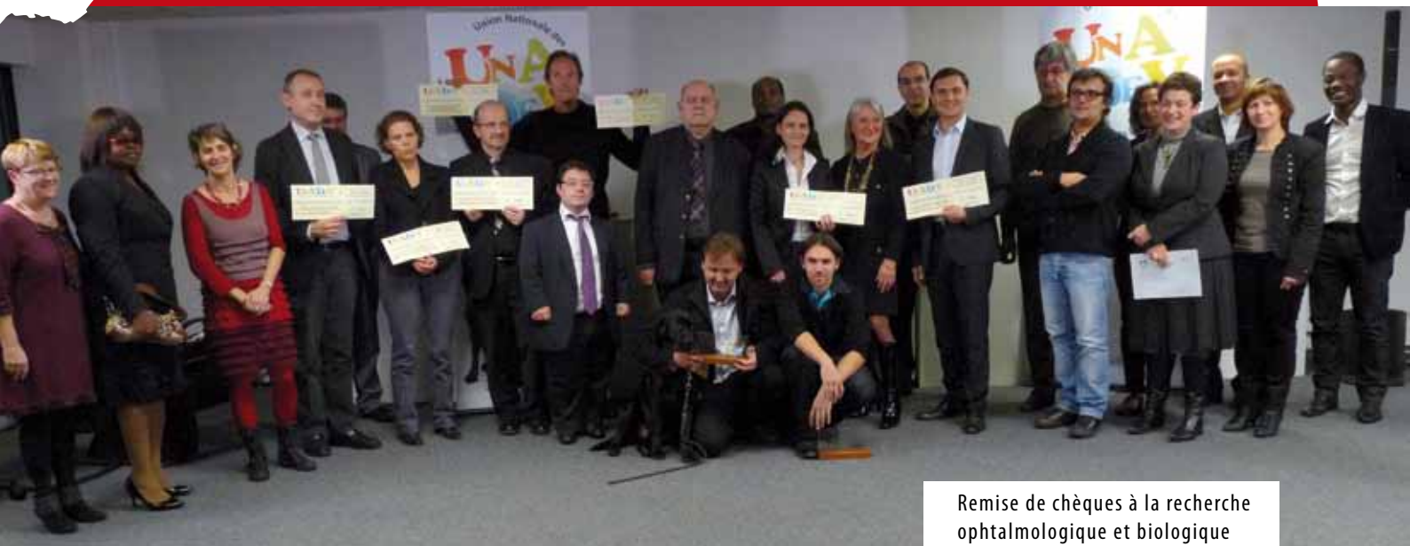
Remise de chèques à la recherche ophtalmologique et biologique