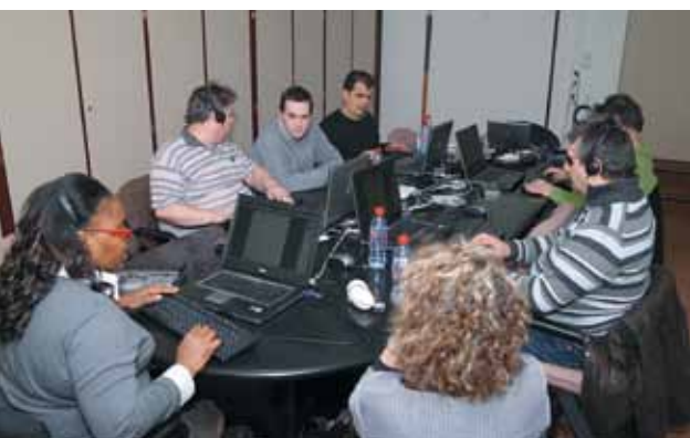
Les formateurs non- et malvoyants du Centre National de Formation à Distance

Dans le cadre du renforcement de son déploiement national, l'UNADEV ouvre une nouvelle antenne à Boulogne-Billancourt en région parisienne. À cette occasion, notre association a mis à l'honneur plusieurs personnes qui ont particulièrement œuvré pour la cause des personnes déficientes visuelles et a remis les chèques de soutien à la recherche ophtalmologique et biologique .